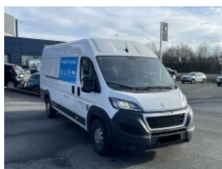
FOTO INFORMATIVNÍ. VŮZ SKLADEM, MOŽNOST ODBĚRU IHNEDE. V PŘÍPADĚ ZÁJMU VOLEJTE TEL. 777 879 119 VOZIDLO JE PRAVIDELNĚ SERVISOVÁNO V AUTORIZOVANÉM SERVISU. PRODLOUŽENÁ ZÁRUKA PVV CONFORT NA 12M.

Koupeno v CZ, První majitel, Servisní kniha