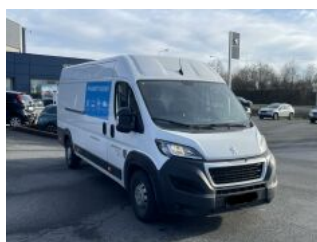
FOTO INFORMATIVNÍ. VŮZ SKLADEM, MOŽNOST ODBĚRU IHNEDE. V PŘÍPADĚ ZÁJMU VOLEJTE TEL. 777 879 119 VOZIDLO JE PRAVIDELNĚ SERVISOVÁNO V AUTORIZOVANÉM SERVISU. PRODLOUŽENÁ ZÁRUKA Autosphere Comfort NA 12M.

Koupeno v CZ, První majitel, Servisní kniha