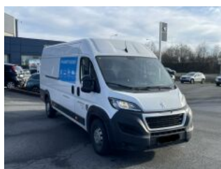
FOTO INFORMATIVNÍ. VŮZ SKLADEM, MOŽNOST ODBĚRU IHNED. V PŘÍPADĚ ZÁJMU VOLEJTE TEL. 777 879 119 VOZIDLO JE PRAVIDELNĚ SERVISOVÁNO V AUTORIZOVANÉM SERVISU. PRODLOUŽENÁ ZÁRUKA PVV CONFORT NA 12M.

Koupeno v CZ, První majitel, Servisní kniha