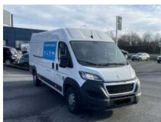
FOTO INFORMATIVNÍ. DOSTUPNOST VOZIDLA NA DOTAZ. V PŘÍPADĚ ZÁJMU VOLEJTE TEL. 777 879 119 VOZIDLO JE PRAVIDELNĚ SERVISOVÁNO V AUTORIZOVANÉM SERVISU. PRODLOUŽENÁ ZÁRUKA Autosphere Comfort NA 12M.

Koupeno v CZ, První majitel, Servisní kniha